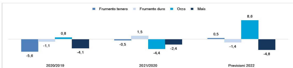
VARIAZIONI PERCENTUALI DELLE PRINCIPALI SUPERFICI A CEREALI RISPETTO ALL'ANNO PRECEDENTE: DATI STORICI E PREVISIONI PER IL 2022