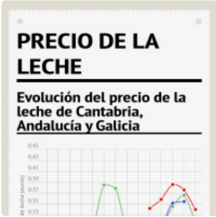
Precio de la leche